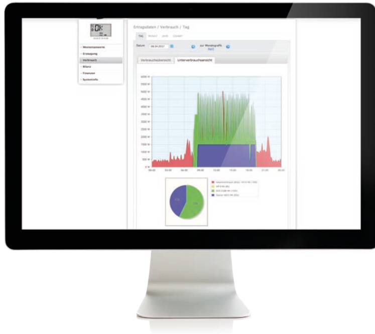
Tagesverbrauchs-Diagramm der angeschlossenen Verbraucher

Die Menüstruktur des Solar-Logs ermöglicht eine intuitive Bedienung. Somit lassen sich intelligente Verbraucher, wie beispielsweise der AC ELWA 2, in Kombination mit Smart Plugs und unter Berücksichtigung des Überschusses ansteuern und priorisieren. Unterschiedliche Energieprofile und Komponenten können miteinander verknüpft und anhand der Simulation überprüft werden.