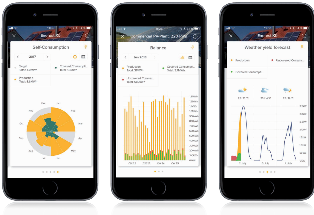
Immagine a sinistra: autoconsumo - immagine centrale: bilancio - sintesi mensile - immagine a destra: previsione meteo